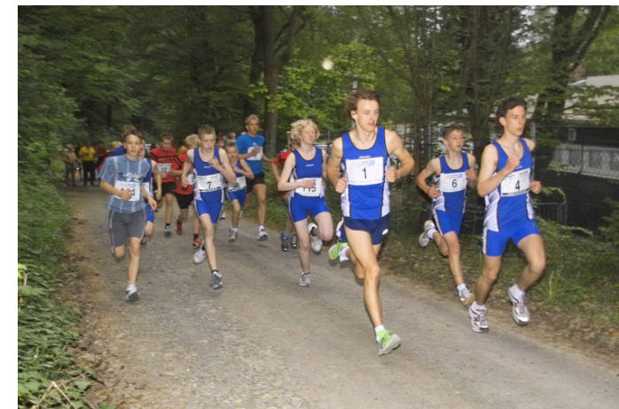
Stadtmeisterschaft im Waldlauf

Nicht nur der Leistungsgedanke steht im Vordergrund, auch Spaß und Geselligkeit, so wie es für einen Breitensportverein üblich ist,