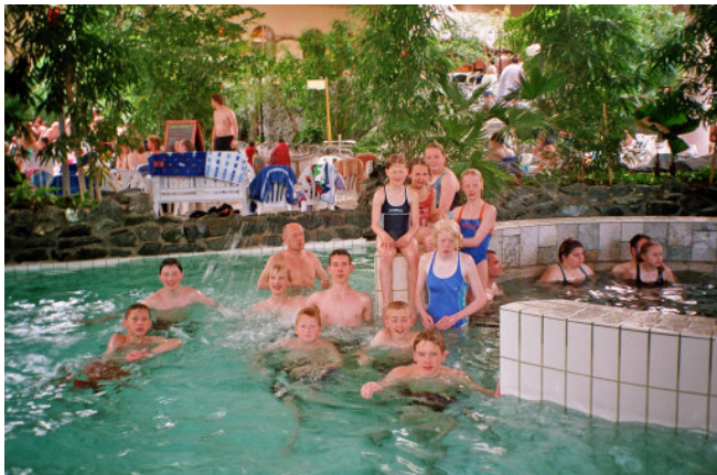
Fahrt in den Centerpark Hochsauerland 2004

kommen nicht zu kurz. Es werden Fahrten in Freizeitparks und Schwimmbäder, Trainingslager an der Ostsee sowie Wanderungen und Grillfeste organisiert.