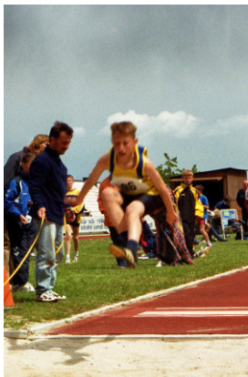
Kreismeisterschaft im Weitsprung 2003