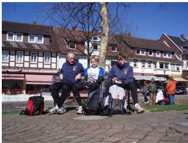
Fahrradtour nach Bodenwerder 2007

Wer Lust hat, bei den Leichtathleten mitzutrainieren, sollte einfach mal während der Trainingszeiten, immer mittwochs um 16:30 Uhr in der Turnhalle Wolfshagen - Triftweg, vorbeischauen.